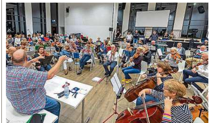
Es wird fleißig geprobt für die „Night of Music“.

Infos und Tickets gibt es unter www.wiesbaden.de und www.wiesbaden-nightofmusic.de .